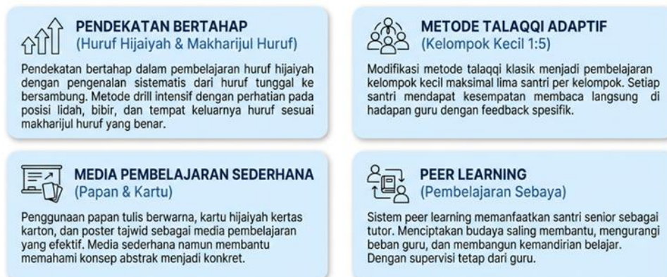
Gambar 2. Strategi Guru Mengaji

Hasil penelitian menunjukkan bahwa guru mengaji di TPQ AlMaidah telah mengembangkan dan menerapkan strategi pengajaran yang komprehensif dan adaptif untuk meningkatkan kemampuan membaca Al-Qur'an santri meskipun menghadapi berbagai keterbatasan. Strategi yang dikembangkan tidak bersifat tunggal melainkan merupakan kombinasi pendekatan yang saling melengkapi dan disesuaikan dengan kondisi spesifik TPQ pedesaan. Guru mengaji menunjukkan pemahaman yang baik tentang tantangan pembelajaran yang dihadapi santri dan mengembangkan respons pedagogis yang kontekstual untuk mengatasinya.