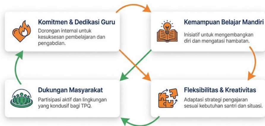
Gambar 3. Faktor-Faktor Kontekstual dan Strategi Adaptif

Keberhasilan implementasi strategi pengajaran di TPQ AlMaidah tidak dapat dilepaskan dari berbagai faktor kontekstual dan pendekatan adaptif yang dikembangkan oleh guru mengaji. Faktor-faktor ini saling berkaitan dan membentuk ekosistem pembelajaran yang mendukung pencapaian tujuan peningkatan kemampuan membaca Al-Qur'an santri meskipun dalam kondisi keterbatasan sumber daya. Pemahaman terhadap faktor-faktor ini memberikan wawasan penting tentang mengapa strategi yang diterapkan dapat efektif dalam konteks spesifik TPQ pedesaan.