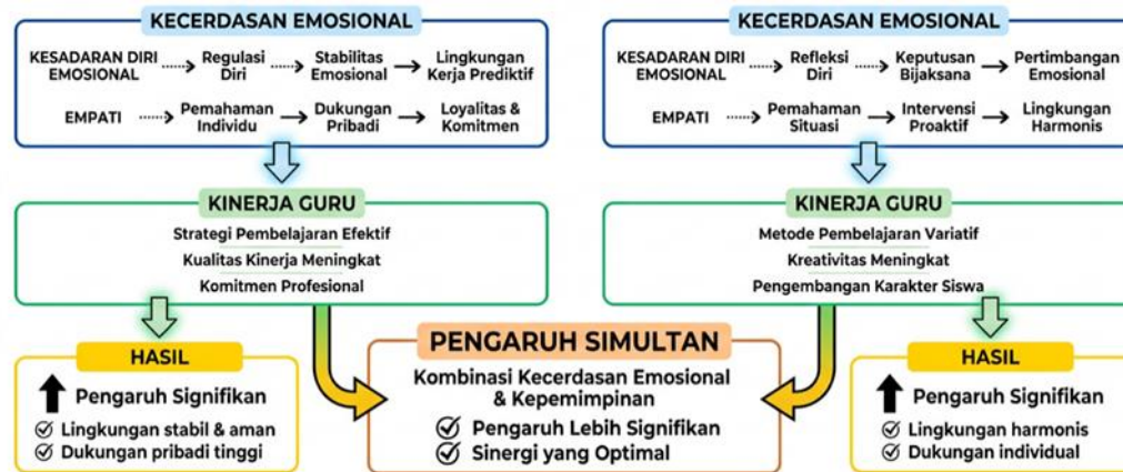
Gambar 3. Pengaruh Kecerdasan Emosional Kepala Madrasah

Dalam dimensi kesadaran diri emosional, kepala madrasah di kedua institusi menunjukkan kemampuan yang sangat baik dalam memahami dan mengelola emosi mereka sendiri. Kepala MAS Al-Jauhar menunjukkan kesadaran yang tinggi terhadap kondisi emosionalnya dan bagaimana emosi tersebut dapat mempengaruhi interaksi dengan guru dan pengambilan keputusan. Dalam beberapa observasi, peneliti melihat bahwa ketika kepala madrasah berada dalam kondisi emosional yang kurang stabil karena tekanan kerja atau masalah pribadi, beliau mampu menyadari kondisi tersebut dan melakukan regulasi diri sehingga tidak membawa emosi negatif dalam berinteraksi dengan guru. Seorang guru yang telah lama bertugas di madrasah tersebut menyatakan bahwa kepala madrasah sangat jarang menunjukkan emosi negatif seperti kemarahan yang tidak terkontrol atau frustrasi yang berlebihan, meskipun menghadapi berbagai tantangan dan tekanan dalam mengelola madrasah. Kemampuan mengelola emosi diri ini menciptakan lingkungan kerja yang stabil dan prediktif, di mana guru merasa aman dan nyaman dalam menjalankan tugas mereka tanpa khawatir menghadapi reaksi emosional yang tidak terduga dari pimpinan.