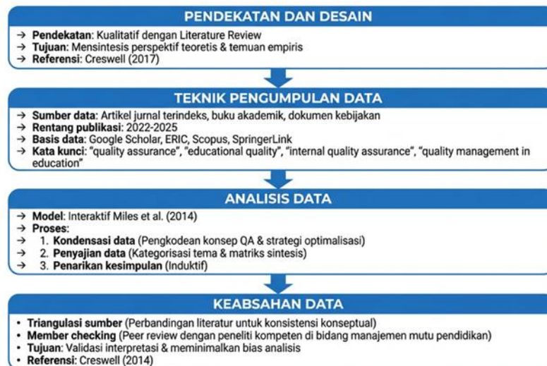
Gambar 1. Kerangka Penelitian.

Analisis data menggunakan model interaktif Miles & Crisp (2014) meliputi kondensasi data melalui pengkodean konsep Quality Assurance dan strategi optimalisasi, penyajian data melalui kategorisasi tema dan matriks sintesis, serta penarikan kesimpulan secara induktif untuk menjawab rumusan masalah. Keabsahan data dijaga melalui triangulasi sumber dengan membandingkan berbagai literatur untuk memastikan konsistensi konseptual, serta member checking melalui peer review dengan peneliti kompeten di bidang manajemen mutu pendidikan untuk memvalidasi interpretasi dan meminimalkan bias analisis (Creswell & Creswell, 2017).