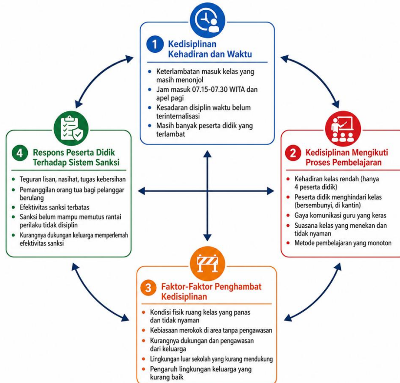
Gambar 3. Kedisiplinan Belajar Peserta Didik

sebelum kegiatan belajar dimulai. Keterlambatan yang berulang ini mengindikasikan bahwa kesadaran peserta didik akan pentingnya disiplin waktu belum sepenuhnya terinternalisasi sebagai nilai yang dihayati dalam keseharian mereka.