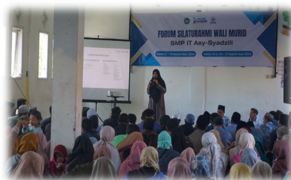
Gambar 3. Pelaksanaan Forum Silaturahmi

memahami kebutuhan anak dan mendukung program sekolah.