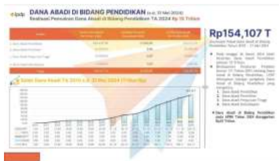
Gambar 1. Dana abadi pendidikan

Pengelolaan Dana Abadi ini diproyeksikan untuk menutupi gap atas kebutuhan membangun Pendidikan anak bangsa dan diharapkan akan bersaing dengan negara lain yang sudah sejak awal mempersiapkan dana abadi Pendidikan untuk warganya.