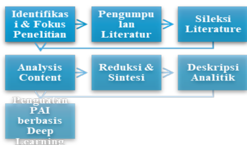
Gambar 1: Bagan Alur Metode Penelitian (Library Research)

Agama Islam (PAI) berbasis deep learning dalam ranah pedagogis yang mencakup mindful , joyful , dan meaningful learning , sehingga data utama bersumber dari literatur yang relevan baik berupa buku, artikel jurnal nasional terakreditasi, maupun jurnal internasional bereputasi (Scopus). Penelitian kepustakaan memungkinkan peneliti melakukan telaah kritis terhadap konsep-konsep yang telah dikembangkan dalam berbagai literatur untuk kemudian dianalisis dan disintesis guna membangun kerangka teoretis yang komprehensif [11]