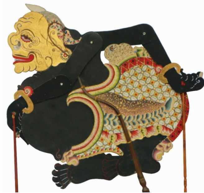
Gambar 2 Semar Wanda Brebes Karya Ki Bambang Suwarno

Secara denotatif, wajah figur Semar karya Ki Bambang Suwarno menampilkan karakter yang segera dapat dikenali dalam tradisi wayang kulit purwa gaya Surakarta. Wajah itu berbentuk bulat, dihiasi dua guratan pada dahi yang menandakan usia tua, hidung bulat dan tenggelam, serta mulut gusen gugut dengan bibir merah sedikit terbuka sehingga sebagian gigi tampak. Mata Semar berbentuk rembesan dengan aksent keketan pada ujungnya, sedangkan kuncung pada kepala menjulang ke atas. Pada bagian telinga tampak subang dengan olahan tataan lengkung yang dipadukan dengan unsur hias kecil berwarna merah. Deskripsi formal ini menunjukkan bahwa wajah Semar dirancang bukan untuk menampilkan keperkasaan aristokratik, melainkan karakter yang akrab, tua, dan komunikatif (Ismunandar K, 1984; Mulyono, 1989).