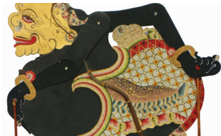
Gambar 5 Tangan Semar, Tatah Sungging Kulit

Pada bagian tangan, Semar digambarkan memiliki dua gestur yang berbeda. Tangan kanan menggenggam, sedangkan tangan kiri menunjuk ke depan. Kedua tangan itu mengenakan gelang dagelan, dan bagian bahu diperpanjang agar gerak wayang dapat dimainkan dengan efektif. Secara denotatif, konfigurasi ini menunjukkan fungsi teknis tangan sebagai satu-satunya anggota tubuh wayang yang dapat digerakkan secara ekspresif (Ahmadi, 2016; Ismunandar K, 1984). Namun, secara konotatif, tangan kanan yang menunjuk mengisyaratkan fungsi penuntun, sedangkan tangan kiri yang menggenggam menandakan kemampuan menahan diri, mengendalikan dorongan, dan menjaga kemuliaan batin. Kedua gestur tersebut saling melengkapi: Semar tidak hanya menunjukkan arah, tetapi juga memberi teladan tentang disiplin diri.