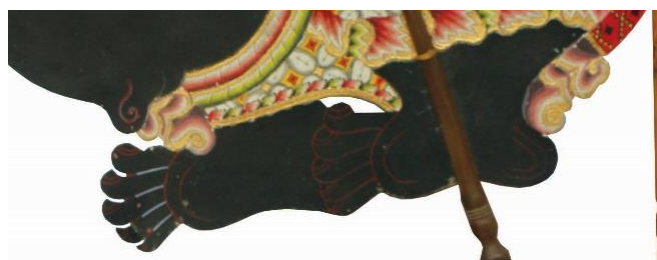
Gambar 5 Tangan Semar, Tatah Sungging Kulit

Pada bagian tangan, Semar digambarkan memiliki dua gestur yang berbeda. Tangan kanan menggenggam, sedangkan tangan kiri menunjuk ke depan. Kedua tangan itu mengenakan gelang dagelan, dan bagian bahu diperpanjang agar gerak wayang dapat dimainkan dengan efektif. Secara denotatif, konfigurasi ini menunjukkan fungsi teknis tangan sebagai satu-satunya anggota tubuh wayang yang dapat digerakkan secara ekspresif (Ahmadi, 2016; Ismunandar K, 1984). Namun, secara konotatif, tangan kanan yang menunjuk mengisyaratkan fungsi penuntun, sedangkan tangan kiri yang menggenggam menandakan kemampuan menahan diri, mengendalikan dorongan, dan menjaga kemuliaan batin. Kedua gestur tersebut saling melengkapi: Semar tidak hanya menunjukkan arah, tetapi juga memberi teladan tentang disiplin diri.