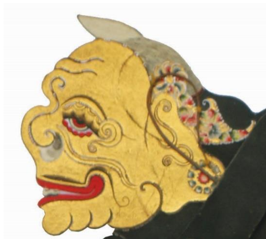
Gambar 3 Wajah Semar, Tatah Sungging Kulit

Secara denotatif, wajah figur Semar karya Ki Bambang Suwarno menampilkan karakter yang segera dapat dikenali dalam tradisi wayang kulit purwa gaya Surakarta. Wajah itu berbentuk bulat, dihiasi dua guratan pada dahi yang menandakan usia tua, hidung bulat dan tenggelam, serta mulut gusen gugut dengan bibir merah sedikit terbuka sehingga sebagian gigi tampak. Mata Semar berbentuk rembesan dengan aksent keketan pada ujungnya, sedangkan kuncung pada kepala menjulang ke atas. Pada bagian telinga tampak subang dengan olahan tataan lengkung yang dipadukan dengan unsur hias kecil berwarna merah. Deskripsi formal ini menunjukkan bahwa wajah Semar dirancang bukan untuk menampilkan keperkasaan aristokratik, melainkan karakter yang akrab, tua, dan komunikatif (Ismunandar K, 1984; Mulyono, 1989).