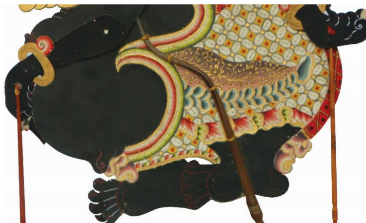
Gambar 4 Tubuh Semar, Tatah Sungging Kulit

Pada tataran awal pemaknaan, wajah sumeh, mata rembesan, dan mulut yang sedikit terbuka menandakan keterbukaan, empati, dan kesiapan menasihati. Hidung yang tenggelam menggeser citra kebangsawanan yang biasanya tegas dan mancung ke arah figur yang rendah hati. Sementara itu, kuncung yang mengarah ke atas dapat dibaca sebagai penanda orientasi transendental, yakni pengakuan bahwa di atas segala urusan duniawi terdapat kuasa ilahi. Kombinasi warna hitam pada wajah dengan unsur broms atau prada emas mempertemukan kesan bumi, kedewasaan, dan ketenangan dengan keluhuran batin yang agung (Kresna, 2012; Mulyono, 1989).