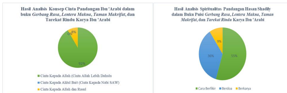
Gambar 2. Konsep Cinta