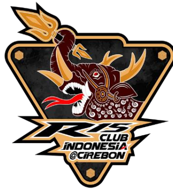
Gambar 5. Logo baru klub motor R15CI@Cirebon

bentuk yang baru dengan cara menggayakan objek, biasanya objek yang distilasi menghasilkan bentuk ornamental (Sasongko et al., 2025, hal. 8). Elemen yang terakhir adalah bentuk lingkaran hitam yang dapat merepresentasikan roda sebagai ikon kendaraan. Warna merah pada visual udang merupakan bentuk penekanan yang merepresentasikan indikasi geografis bahwa udang merupakan identitas lokal masyarakat Cirebon yang diambil dari komoditas ekonomi. Logo tersebut pada 2023 kemudian mengalami redesain sebagai upaya untuk menghindari terjadinya polemik karena berkaitan dengan penggunaan logo brand Yamaha seperti yang ditampilkan pada gambar 4. Logo hasil redesain ditampilkan pada gambar 5 dan mulai digunakan 17 Agustus 2023.