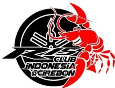
Gambar 4. Logo awal klub motor R15CI@Cirebon