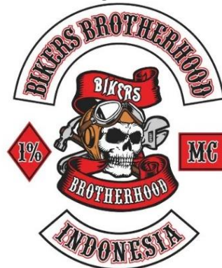
Gambar 1. Logo klub motor Brotherhood Indonesia