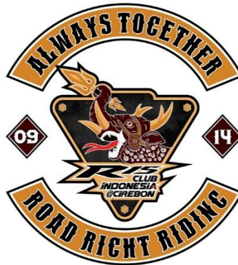
Gambar 8. Logo klub motor R15CI@Cirebon dengan tagline

Penerapan logo Klub Motor R15CI@Cirebon pada berbagai media aplikasinya, terdapat elemen tambahan berupa tagline seperti yang ditampilkan pada Gambar 8. Tujuannya adalah untuk menciptakan kesan yang tak terlupakan, maka digunakanlah tagline , yaitu sebuah ungkapan singkat. Sebuah tagline didefinisikan sebagai frase ringkas yang bertujuan menciptakan kesan mendalam dan permanen, fungsi tagline adalah untuk meningkatkan daya ingat merek ( brand recall ), memastikan merek tersebut terus diingat oleh khalayak ketika mereka sedang mencari produk untuk memenuhi kebutuhan atau keinginan mereka (Andary & Tamsil, 2024, hal. 535). Tagline klub motor ini adalah “ Always Together, Road Right Riding ” yang artinya selalu bersama dan berkendara di jalan yang benar. Tagline ini mencerminkan komitmen inti klub motor tersebut untuk selalu mengutamakan keselamatan di jalan raya. Hal ini diwujudkan melalui perilaku yang bertanggung jawab, jauh dari kesan ugal-ugalan, serta kepatuhan penuh terhadap peraturan lalu lintas dan peraturan-undangan yang berlaku, termasuk disiplin dalam kelengkapan dokumen kendaraan dan surat izin mengemudi. Lebih lanjut, tagline ini juga berfungsi sebagai sarana komunikasi kepada masyarakat untuk menepis stigma negatif yang sering dilekatkan pada klub motor. Klub Motor R15CI@Cirebon ingin menegaskan bahwa mereka berbeda dari anggapan umum tersebut, sekaligus membuktikan bahwa masih banyak komunitas motor yang menjunjung tinggi dan memenuhinya dalam lalu lintas.