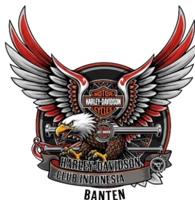
Gambar 2. Logo klub motor Harley Davidson Club Indonesia – Banten Chapter