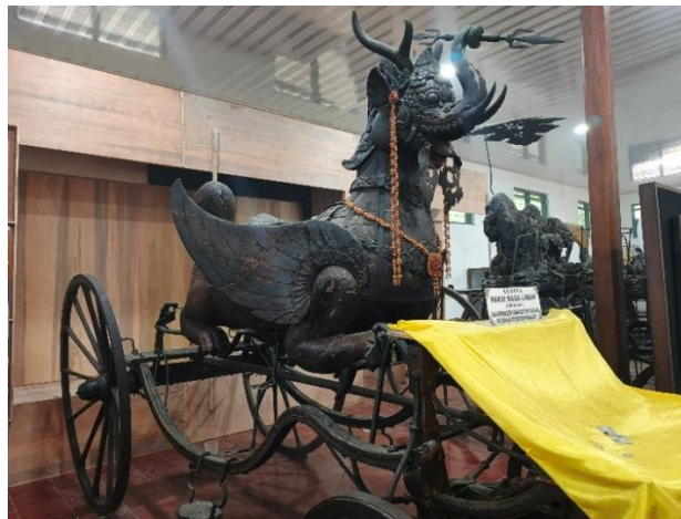
Gambar 3. Kereta Kencana Paksi Naga Liman Sumber: Dokumentasi oleh Ismail Bambang Subianto, 2025

Paksi Naga Liman sejatinya merupakan dekorasi kendaraan Sultan Cirebon yang saat ini berada di museum pusaka Keraton Kanoman, wujudnya terbentuk dari tiga entitas yang berbeda, masing-masing mewakili tiga kultur berbeda pula. Wujudnya merupakan penggabungan dari tiga unsur hewan yang hidup di tiga alam berbeda, Paksi (dunia atas/ langit), Naga (dunia bawah/ air), dan Liman (dunia tengah/ darat) (Fikriyyati & Suardana, 2020, hal. 210). Wujud hibrid tersebut kemudian ditransformasikan pada kereta kencana kesultanan sebagai bentuk representasi visual yang kaya akan makna akulturasi budaya dari berbagai peradaban yang memengaruhi Cirebon, terutama Hindu/ Budha, Tiongkok, dan Islam.