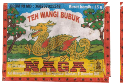
Gambar 3. Penggunaan border dalam visual kemasan kemasan Teh Naga Super