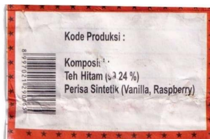
Gambar 6. Keterangan kode produksi pada teh naga super

Jenis huruf sans serif yang digunakan pada kemasan seperti yang terlihat pada Gambar 6, tampak sederhana dan mudah dibaca. Sans serif umumnya dipilih untuk teks informasi karena keterbacaannya yang tinggi, bahkan dalam ukuran yang lebih kecil. Penggunaan sans serif pada informasi seperti "Kode Produksi," "Komposisi," dan detail bahan memastikan bahwa teks dapat dibaca dengan jelas dan mudah, terutama oleh konsumen yang mencari informasi spesifik tentang produk. Ukuran huruf yang tidak terlalu besar, tetapi cukup tebal menunjukkan pendekatan fungsional, dimana informasi ditekankan untuk kebutuhan baca, bukan untuk daya tarik visual. Teks menggunakan perataan kiri, yang umumnya memudahkan pembacaan dan menambah keteraturan dalam penyajian informasi.