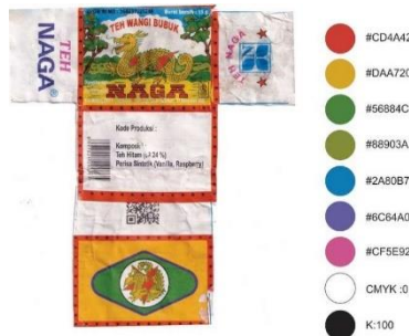
Gambar 4. Penggunaan warna pada visual kemasan kemasan Teh Naga Super

Visual kemasan Teh Naga Super didominasi oleh penggunaan warna-warna hangat seperti hijau serta warna-warna panas seperti merah dan kuning.