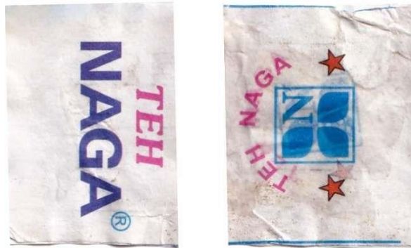
Gambar 7. Tampilan sisi kanan dan kiri kemasan Teh Naga Super

dan tegas, menjadikan nama "NAGA" sebagai fokus utama pada kemasan. Sementara itu, kata "TEH" yang menggunakan font serif memberikan sedikit variasi visual, menambah sentuhan yang lebih halus, namun tetap mudah dibaca.