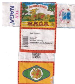
Gambar 1. Kemasan lipat Teh Naga Super

Teh Naga merupakan merek teh wangi beraroma vanila yang diproduksi dan dipasarkan oleh Perusahaan Teh Naga. Produk ini pertama kali diperkenalkan pada tahun 1970 dalam bentuk teh kering siap seduh. Perusahaan Teh Naga berdiri di Kecamatan Lawang, Kabupaten Malang, dan didirikan oleh sebuah keluarga kecil yang tinggal di sekitar Pasar Lawang. Usaha ini bermula dari industri rumahan yang memanfaatkan ketersediaan bahan baku teh dari kebun di sekitar tempat tinggal mereka. Seiring waktu, Teh Naga makin diminati oleh masyarakat di Lawang hingga meluas ke wilayah Kota Malang. Dalam proses produksinya, Teh Naga menggunakan bahan baku alami yang diolah menjadi teh wangi dengan campuran bunga vanila serta beberapa racikan tradisional lainnya.