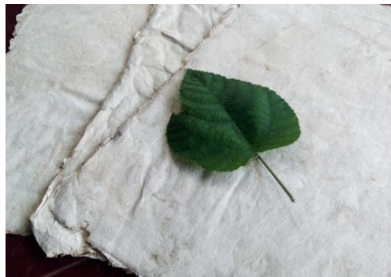
Gambar 4. Wujud Kertas gendhong Tegalsari

Keterhubungan sanad , baik secara genealogi keluarga, keilmuan, maupun jejaring sosial antara Pesantren Tegalsari dan Pondok Modern Darussalam Gontor memberi fondasi sosial-kultural bagi keberlanjutan tradisi gendhong pada masa kini. Ketika Tegalsari meredup pada awal abad ke-20 dan kertas Eropa kian dominan, tradisi gendhong di banyak tempat surut. Melalui jejaring sanad yang memungkinkan revitalisasi pada 2020, atas prakarsa komunitas santri Gontor (dipimpin Joko Santoso) dengan memanfaatkan kembali paper mulberry/glugu sebagai bahan baku (Soetikna, 1939; Styono, 2024). Etnografi kritis melihat tindakan komunitas Gontor tidak hanya menghidupkan teknik, melainkan konfigurasi otoritas dan makna pada wujud kertas gendhong (Gambar 4). Pelestarian menjadi praktik reflektif, partisipatif, dan berorientasi emansipasi komunitas pengetahuan (Madison, 2019; Creswell, 2018).