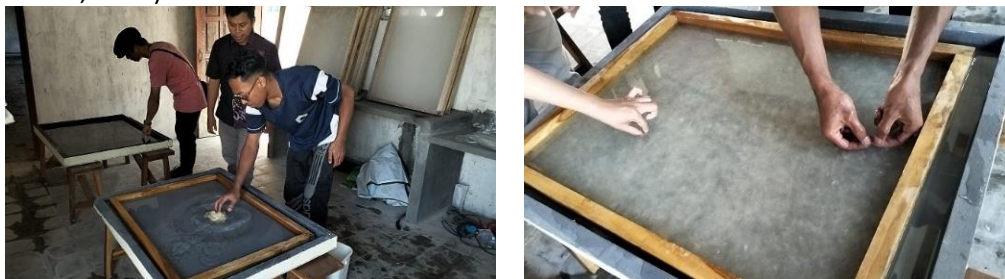
Gambar 10. Pembuatan kertas cetak serat oleh Joko Santoso

Melalui sisi pemecahan masalah, eksperimen cetak serat menjawab persoalan teknis yang ada pada kertas gendhong tradisional. Misalnya, daya serap tinta dan ketidakrataan permukaan, yang kurang mendukung kebutuhan kaligrafi. Melalui penyempurnaan proses pembentukan lembar, pemadatan, dan penggilapan. Proses ( Gambar 10 ) ini menghasilkan kertas dengan kualitas yang lebih stabil untuk praktik tulis estetik. Hal ini menegaskan bahwa kreativitas tidak hanya berkaitan dengan penciptaan bentuk baru, tetapi juga bagaimana tradisi mampu beradaptasi dan memecahkan problem aktual (Derman, 1998).