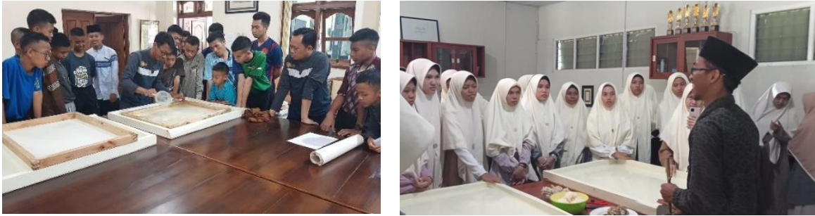
Gambar 11. Pengenalan kertas cetak serat di Pondok Gontor

Kegunaan inovasi ini tidak terbatas pada pelestarian kertas gendhong semata, tetapi juga memperluas fungsi budaya ke ranah pendidikan dan seni. Sebagai media kaligrafi, kertas cetak serat memberi nilai tambah edukatif. Santri tidak hanya mempelajari keterampilan menulis indah, tetapi juga menyerap nilai kesabaran, ketekunan, dan keikhlasan yang terkandung dalam proses pembuatan kertas tradisional. Fungsi ini sejalan dengan visi pesantren sebagai pusat pendidikan berbasis tradisi yang mengintegrasikan aspek intelektual, kultural, dan spiritual (Dhofier, 2011).