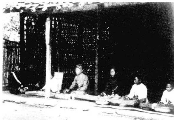
Gambar 3. Proses Pembuatan Kertas dengan Teknik Kemplong kulit pohon murbei di Tegalsari

Gambar 2 ini memperlihatkan suasana proses pembelajaran di Pesantren Tegalsari pada tahun 1926, yang merepresentasikan tradisi literasi Islam Jawa berbasis manuskrip. Dalam konteks ini, sejarah kertas gendhong menjadi bagian integral dari dinamika akulturasi budaya, di mana pengetahuan Islam ditransmisikan melalui medium lokal yang diproduksi secara tradisional. Sebelum berfungsi sebagai media tulis pesantren, kulit kayu gedhong telah digunakan sebagai kain kulit kayu yang dinamakan ( fuya/tapa ). Kain kulit kayu ini telah digunakan sejak zaman prasejarah, sebagaimana dibuktikan dengan penemuan alat pemukul kulit kayu atau batu ike di lokasi arkeologi (Baharuddin, Seriyanti, Hidayat, & Al Anshori, 2024). Transformasi dari bahan busana menjadi medium tulis merepresentasikan evolusi teknologi material dalam tradisi Nusantara (Kristofer, 2005). Sumber-sumber klasik menyebutkan adanya penanaman pohon glugu di sekitar lingkungan religius sebagaimana tercantum dalam Piagam Sarwadharma, yang kemudian menjadi bahan utama pembuatan kertas gendhong di wilayah Tegalsari. Kajian kolonial dan filologis memperkuat bahwa medium ini telah lama menjadi bagian dari ekologi religius dalam budaya Jawa (Guillot, 1983; Raffles, 2014). Pilihan Pesantren Tegalsari untuk menggunakan kertas gendhong daripada papyrus atau kertas Arab dapat dipahami sebagai keputusan yang bersifat kultural. Hal ini sebagai upaya merawat kesinambungan lokal sekaligus menegosiasikan pengaruh Islam global (Guillot, 1985).