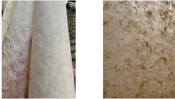
Gambar 5. Wujud Kertas Cetak Serat di Pondok Gontor

(finishing) untuk mencapai hasil yang optimal. Hal ini bertujuan untuk menghasilkan lembar kertas yang stabil secara permukaan (konsistensi kehalusan) dan terkendali daya serapnya. Kedua karakteristik tersebut menjadi aspek penting dalam menjaga ketepatan dan keindahan goresan pena kaligrafi. Di sinilah santri mengadaptasi pengetahuan tentang pelapisan dan penggilapan. Teknik pelapisan ini, yang dalam tradisi manuskrip Islam dikenal luas sebagai ahar atau aharli , banyak ditemukan pada kertas Persia dan Utsmani. Tujuan pelapisan ini adalah untuk mencegah feathering atau bleeding , meningkatkan kelancaran gerak pena ( glide ), serta menjaga kejernihan garis (Derman, 1998). Hasil dari proses ini adalah kertas mukohar ( muqahhar ), yakni kertas tradisional buatan tangan yang dipersiapkan secara khusus untuk penulisan kaligrafi.