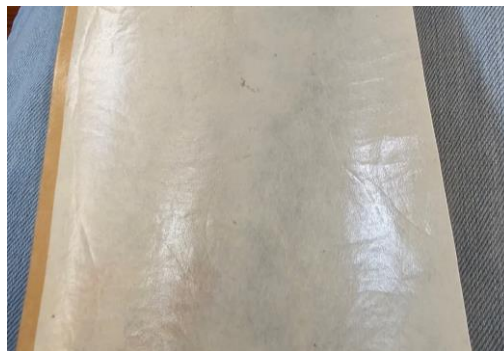
Gambar 6. Wujud Inovasi pengembangan Kertas gendhong menjadi Kertas Mukohar

Dalam perspektif etnografi kritis, inovasi ini memperlihatkan bagaimana komunitas santri menegosiasikan warisan teknik dengan kebutuhan praktik estetika religious dalam wujud kertas cetak serat (Gambar 5). Nilai kesabaran, ketekunan, dan spiritualitas yang melekat pada proses pembuatan kertas tradisional direartikulasi sebagai pengalaman kreatif yang menumbuhkan rasa kepemilikan budaya (Creswell, 2018; Sedyawati, 2008). Material utama berupa pohon glugu tetap dipertahankan sebagai bahan yang secara historis mengakar dalam tradisi Tegalsari yang nantinya di lapis menjadi kertas mukohar (Gambar 6). Para santri Gontor memelihara rantai makna antara material lokal, disiplin tulis, dan ibadah, sekaligus menghasilkan artefak yang relevan bagi praktik kaligrafi di lingkungan pesantren.