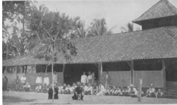
Gambar 2. Proses pembelajaran di Pesantren Tegalsari tahun 1926

Indonesia. Pemilihan material alami ini tidak sekadar bersifat pragmatis, melainkan mencerminkan pengetahuan ekologis dan kearifan material dalam tradisi Pesantren Tegalsari. Teks-teks keagamaan yang ditulis maupun disalin menggunakan material lokal yang tersedia di lingkungan pesantren, khususnya kertas gendhong yang diproduksi dari serat alami di wilayah Tegalsari. Di Pesantren Tegalsari, kertas gendhong menjadi media utama untuk penyalinan kitab kuning, tafsir, hingga teks sufistik, menegaskan relasi erat antara materialitas medium dan reproduksi ilmu (Guillot, 1983, 1985; Dhofier, 1982).