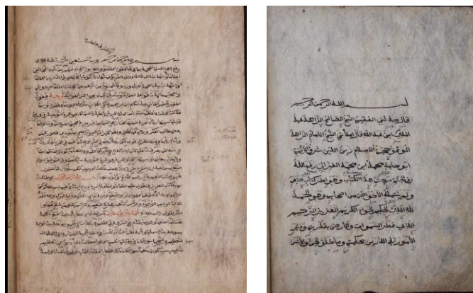
Gambar 7. Manuskrip peninggalan Pesantren Tegalsari ditulis pada kertas gendhong

Transmisi nilai budaya dari Tegalsari ke Gontor tidak berlangsung secara langsung dalam bentuk praktik teknis yang berkesinambungan. Transmisi ini melalui jalur sanad nasab dan otoritas keilmuan pesantren. Pondok Modern Darussalam Gontor berdiri di awal abad ke-20, saat Tegalsari memasuki masa surut. Meskipun demikian, hubungan genealogi intelektual antara dua pesantren ini memungkinkan nilai-nilai literasi, etos kesederhanaan, dan tradisi penguasaan ilmu yang melekat pada Tegalsari tetap hidup dalam kultur pendidikan Gontor (Dhofier, 2011). Meskipun ada rentang waktu kosong dalam produksi kertas, spirit literasi Tegalsari tetap ditransmisikan melalui jalur pendidikan. Teks-teks kitab yang diwariskan, dan etos keilmuan yang dijaga melalui komunitas ulama dan santri di Gontor.