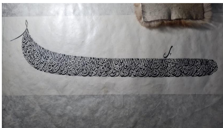
Gambar 8. Kaligrafi pada kertas cetak serat Pondok Gontor

Transmisi nilai budaya dari Tegalsari ke Gontor tidak berlangsung secara langsung dalam bentuk praktik teknis yang berkesinambungan. Transmisi ini melalui jalur sanad nasab dan otoritas keilmuan pesantren. Pondok Modern Darussalam Gontor berdiri di awal abad ke-20, saat Tegalsari memasuki masa surut. Meskipun demikian, hubungan genealogi intelektual antara dua pesantren ini memungkinkan nilai-nilai literasi, etos kesederhanaan, dan tradisi penguasaan ilmu yang melekat pada Tegalsari tetap hidup dalam kultur pendidikan Gontor (Dhofier, 2011). Meskipun ada rentang waktu kosong dalam produksi kertas, spirit literasi Tegalsari tetap ditransmisikan melalui jalur pendidikan. Teks-teks kitab yang diwariskan, dan etos keilmuan yang dijaga melalui komunitas ulama dan santri di Gontor.