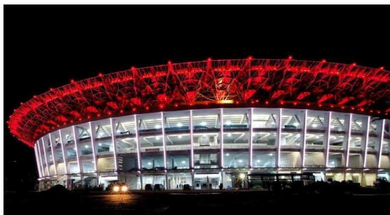
Gambar 2. Teknologi Fasad GBK

Skala bangunan GBK dirancang dalam ukuran yang besar dan monumental[8], sejalan dengan fungsinya sebagai stadion utama tingkat nasional dan internasional. Skala ini tidak hanya menegaskan kapasitas dan fungsi bangunan, tetapi juga berperan dalam membangun citra simbolik sebagai representasi kebanggaan nasional. Dominasi skala tersebut menjadikan GBK mudah dikenali dalam lanskap kota Jakarta dan memperkuat perannya sebagai pusat kegiatan olahraga berskala besar. Skala monumental pada bangunan olahraga sering diasosiasikan dengan representasi kekuatan institusional dan identitas nasional. Dalam hal ini, skala tidak hanya berkaitan dengan kapasitas fisik, tetapi juga menjadi strategi visual dalam membangun citra simbolik stadion sebagai ruang kolektif.