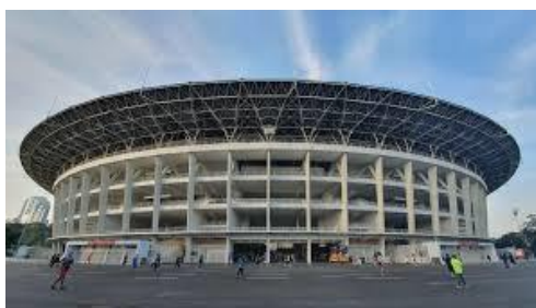
Gambar 1. Stadion Gelora Bung Karno

GBK menampilkan karakter monumental dengan komposisi simetris dan siluet “temu gelang” yang kuat. Monumentalitas pada bangunan publik berfungsi membangun identitas kolektif dan simbol kebangsaan[6], [8]. Siluet atap “temu gelang” menjadi elemen bentuk yang paling ikonik dan mudah dikenali dari stadion ini (Gambar 2). Bentuk atap yang melingkar dan kontinu tersebut tidak hanya berfungsi sebagai elemen struktural dan pelindung, tetapi juga membentuk identitas visual yang kuat melalui garis horizontal yang tegas. Siluet ini menciptakan kesan monumental sekaligus elegan, serta merefleksikan pendekatan desain modern yang mengutamakan kejelasan struktur dan kesederhanaan bentuk. Dengan demikian, siluet “temu gelang” tidak hanya menjadi elemen struktural, tetapi juga penanda visual yang memperkuat identitas GBK dalam konteks urban Jakarta.