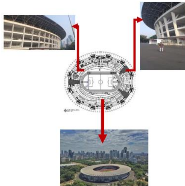
Gambar 3. Tampak Stadion GBK

yang unik, pola ini berfungsi sebagai ventilasi alami yang memungkinkan sirkulasi udara cukup di dalam stadion serta menambah nilai estetika melalui permainan cahaya dan bayangan (Gambar 3 dan 4). Dari segi teknologi, GBK mengintegrasikan sistem pencahayaan LED yang hemat energi, di mana konsumsi listriknya diklaim lebih hemat 50 persen dibandingkan lampu konvensional. Integrasi teknologi pencahayaan adaptif menunjukkan bahwa identitas fasad tidak bersifat statis, melainkan dapat diaktualisasikan melalui ekspresi visual dinamis sesuai konteks acara. Dengan demikian, teknologi berfungsi sebagai elemen performatif yang memperbarui citra historis GBK ke dalam bahasa arsitektur kontemporer.