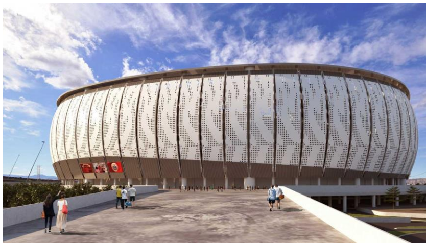
Gambar 5. Fasad Jakarta Internasional Stadion

JIS merepresentasikan pendekatan futuristik melalui bentuk oval dinamis dan sistem retractable roof . Stadion modern sering menggunakan ekspresi teknologi sebagai simbol kemajuan dan daya saing global[4]. Berbeda dengan GBK yang menekankan kontinuitas historis, JIS secara sadar mengadopsi bahasa arsitektur kontemporer dengan geometri oval dan selubung fasad yang ekspresif (Gambar 5). Bentuk oval dengan garis lengkung dominan menciptakan kesan aerodinamis dan futuristik, yang merepresentasikan kemajuan teknologi dan daya saing global. Dengan demikian, bentuk fasad JIS tidak hanya bersifat estetis, tetapi menjadi simbol inovasi dan orientasi masa depan.