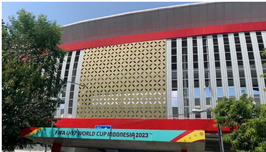
Gambar 7. Motif Kawung pada Fasad Manahan

Dari aspek komponen fasad, Stadion Manahan menampilkan secondary skin bermotif Batik Kawung yang menjadi elemen visual utama. Motif ini merepresentasikan nilai budaya Jawa dan menjadi media translasi simbol lokal ke dalam bahasa arsitektur kontemporer. Penerapan double skin facade berfungsi sebagai pengendali iklim sekaligus pembentuk ekspresi visual[3], [4]. Pendekatan ini menunjukkan integrasi harmonis antara simbolisme budaya dan sistem performatif. Dengan demikian, komponen fasad tidak hanya berfungsi sebagai pelindung bangunan, tetapi juga sebagai perangkat representatif yang menghubungkan stadion dengan identitas kota Surakarta sebagai pusat budaya Jawa.