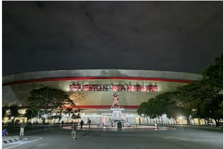
Gambar 7. Stadion Manahan Solo

Dari aspek komponen fasad, Stadion Manahan menampilkan secondary skin bermotif Batik Kawung yang menjadi elemen visual utama. Motif ini merepresentasikan nilai budaya Jawa dan menjadi media translasi simbol lokal ke dalam bahasa arsitektur kontemporer. Penerapan double skin facade berfungsi sebagai pengendali iklim sekaligus pembentuk ekspresi visual[3], [4]. Pendekatan ini menunjukkan integrasi harmonis antara simbolisme budaya dan sistem performatif. Dengan demikian, komponen fasad tidak hanya berfungsi sebagai pelindung bangunan, tetapi juga sebagai perangkat representatif yang menghubungkan stadion dengan identitas kota Surakarta sebagai pusat budaya Jawa.