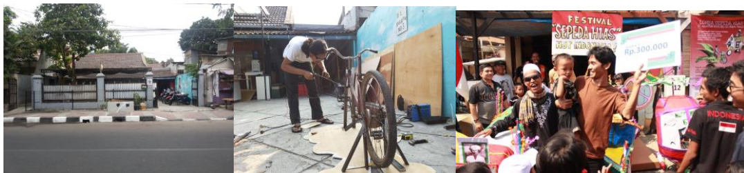
Gambar 2: Ragam kegiatan di garasi serum: parkir motor, workshop, dan acara untuk warga sekitar

Contoh lain alihfungsi ruang adalah garasi yang pada hari-hari biasa sebagai tempat parkir motor, menjadi area produksi untuk pekerjaan kayu, besi, dan logam sekitar sebulan sekali. Ketika digunakan sebagai ruang produksi, motor-motor anggotanya harus diparkir di tepi jalan sementara area garasi kosong. Selain area kerja, produksi, dan istirahat, bagian dalam rumah juga berubah menjadi ruang pameran setiap 2-3 bulan sekali. Di luar itu, ruang dalam rumah kembali menjadi ruang bekerja dan produksi, memfasilitasi penghuninya untuk bekerja dengan laptop, menggunakannya sebagai studio foto, studio lukis, cetak sablon, dan sebagainya.