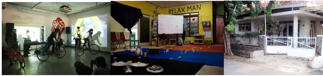
Gambar 3: Ragam fungsi rumah ruangrupa pada sejak awal 2000-an

Di rumah ketiga, ruangrupa mengalami perluasan fungsi ruang sosial melalui program-program rutin seperti forum mahasiswa Jakarta 32 derajat, residensi seniman, dan galeri pameran yang lebih intensif dipakai. ruangrupa juga mulai aktif terlibat pada perhelatan seni di luar ruangnya sendiri, baik di Indonesia maupun mancanegara, menyebabkan sirkulasi orang yang semakin intensif, sehingga rumah perlahan-lahan memiliki ruang-ruang yang didedikasikan untuk menginap tamu-tamu residensi. Dalam perluasan ruang sosial, ruangrupa selalu memiliki satu ruang tengah, di mana diskusi, pameran, pemutaran film, pesta, pasar barang bekas terjadi, dengan tujuan mengumpulkan publik seluas-luasnya, baik warga sekitar maupun teman-teman dari jejaring lainnya. Dari penggunaan ruang yang rutin dan intensif, seringkali gagasan tumbuh, baik dari forum, presentasi karya, pemutaran, atau sekedar kegiatan pertemuan sosial nongkrong. Di rumah ketiga, aktivitas menjamu para tamu juga mulai menjadi sebuah kebiasaan, sehingga rumah ruangrupa mulai berperan menjadi simpul pertemuan sosial yang cukup strategis bagi seniman-seniman muda era itu.