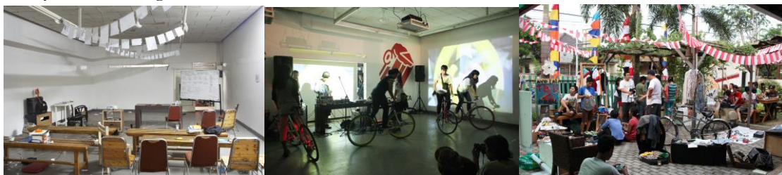
Gambar 4: Ragam fungsi rumah kontrakan ruangrupa di Tebet, dari kelas, pertunjukan, pameran, hingga pasar barang bekas

Lambat laun, di rumah keempat, tata letak dan fungsi ruang mulai terstruktur. Salah satunya ditandai dengan ruang yang didedikasikan untuk toko di bagian depan rumah, sebagai strategi keberlanjutan ekonomi kolektif. Selain itu, ruang-ruang mulai dipisahkan berdasarkan divisi program-program ruangrupa, salah satunya, kemunculan entitas rururadio. Era rumah terakhir ruangrupa juga menandai peran rumah ruangrupa sebagai simpul berbagi ruang antar entitas kolektif, baik di dalam ruangrupa maupun jejaringnya. ruangrupa memberi ruang untuk tumbuhnya band-band independen ibukota sejak 2000-an hingga 2015. Bagian lantai dua rumah digunakan sebagai ruang kerja band-band yang ada di bawah jejaring ruangrupa. Selain itu, mereka juga aktif menggelar pertunjukan untuk mempromosikan band-band yang dikelola dalam jejaringnya. Praktik membuka dan berbagi ruang ini memperkuat jejaring pertemanan dan relasi kerja, sekaligus menjadi cikal bakal pola kolaborasi dan pemanfaatan ruang kerja bersama yang berlanjut di era berikutnya, di Gudang Sarinah Ekosistem.