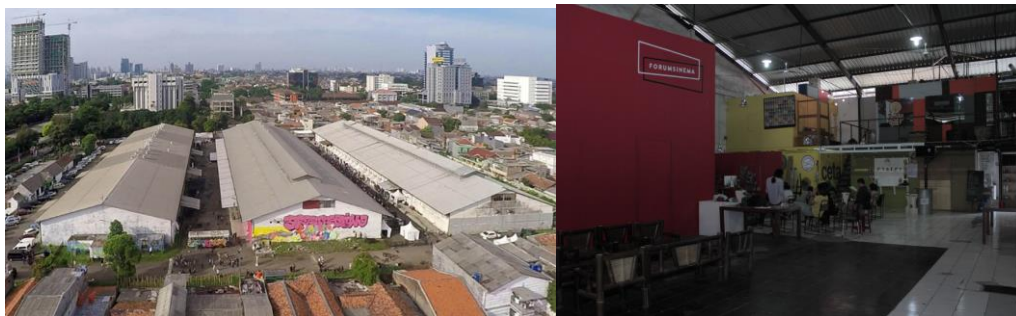
Gambar 5: Foto udara tiga bangunan Gudang Sarinah Ekosistem (kiri) dan hall A (kanan)

Hall A, yang terletak di bagian paling depan, dibagi menjadi empat area, hall A1, A2, A3, A4. Hall A1 digunakan sebagai ruang publik, dengan fungsi bioskop, perpustakaan, toko, stasiun radio, dapur komunal, studio grafis, dan ruang tamu—melanjutkan jenis-jenis ruang yang sebelumnya sudah dimiliki oleh masing-masing kolektif. Hall A2 digunakan sebagai ruang pengelola dan galeri kolektif, hall A3 dipecah sebagai studio-studio yang disewakan ke komunitas dan seniman menggunakan kontainer, dan A4 digunakan sebagai arena skate park dan beralih fungsi menjadi kantor oleh perusahaan media setelahnya. Hall B, di bagian belakangnya, digunakan sebagai galeri dan ruang pertunjukan berskala besar. Hall A dikelola hampir sepenuhnya untuk memenuhi kebutuhan ekspresi, edukasi, dan apresiasi entitas kolektif Gudang Sarinah Ekosistem. Sedangkan hall B bersifat lebih terbuka pada berbagai kemungkinan kerjasama dengan pihak lain.