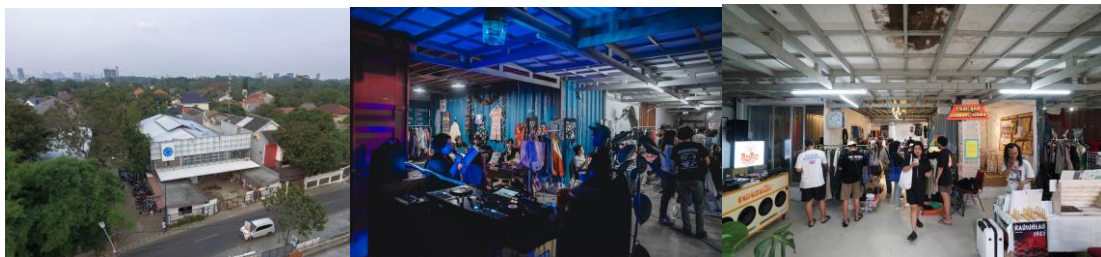
Gambar 6: Gudskul 2020 (kiri dan tengah) dan saat pasar Holy Market 2026 (kanan)

Sejak 2018 hingga 2025, Gudskul mengalami transformasi ruang seiring perubahan bentuk organisasi. Sebagai sebuah ruang bersama, Gudskul meleburkan sekat-sekat kolektif secara tata kelola kelembagaan maupun fisik arsitektural. Di awal masa pembentukan Gudskul, lantai dasar bangunan mereka mengakomodasi kebutuhan Art Collective Compound, terdiri dari sekat-sekat ruang yang berdiri masing-masing untuk memenuhi sub-divisi dari setiap kolektif. Pada 2018, lantai dasar Gudskul memiliki tiga galeri yang terpisah: ruru gallery, serrum gallery, dan rux container. Tujuannya di awal yakni untuk tetap mewadahi keberagaman bentuk artistik dan pendekatan program yang berbeda. Namun, setelah 2022, Gudskul melebur galeri tersebut menjadi satu dengan nama GUDS Gallery. Peleburan ini seiring dengan konsolidasi bentuk-bentuk program dan aktivitas setiap entitas di Gudskul yang serupa.