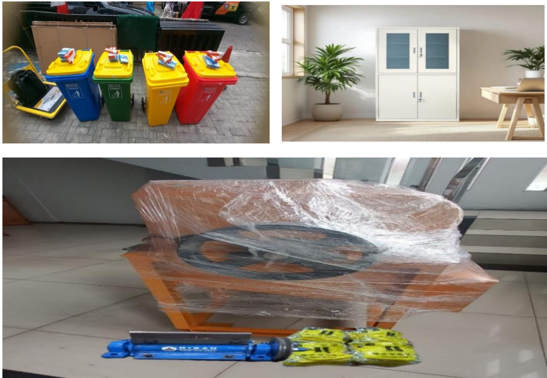
Gambar 3. Bantuan Teknologi (Sederhana) & Inovasi untuk Pengelolaan 4 Bank Sampah

Pendampingan & Evaluasi Tim PkM UIA setelah pelatihan, yaitu dalam pemanfaatan/penggunaan peralatan/ perlengkapan pengelolaan Bank Sampah (Bulan September s/d Oktober 2025). Hasil pendampingan penggunaan mesin pencacah plastik yang mengubah sampah plastik dari anggota pengumpul menjadi butiran kasar yang harga penjualannya meningkat 100%, yaitu sebelum menggunakan teknologi mesin pencacah plastik hasil penjualan sampah plastik sebesar = Rp. 3000,00/kg dan setelah menggunakan mesin pencacah plastik (butiran plastik) harga penjualannya menjadi Rp. 6000,00/kg. (lihat Gambar 4 & Gambar 5).