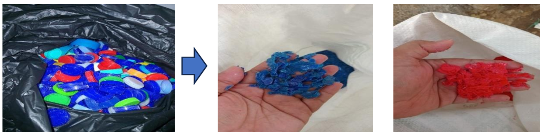
Gambar 4: Butiran Kasar Hasil Olahan Plastik Menggunakan Mesin Pencacah Plastik

Pendampingan & Evaluasi Tim PkM UIA setelah pelatihan, yaitu dalam pemanfaatan/penggunaan peralatan/ perlengkapan pengelolaan Bank Sampah (Bulan September s/d Oktober 2025). Hasil pendampingan penggunaan mesin pencacah plastik yang mengubah sampah plastik dari anggota pengumpul menjadi butiran kasar yang harga penjualannya meningkat 100%, yaitu sebelum menggunakan teknologi mesin pencacah plastik hasil penjualan sampah plastik sebesar = Rp. 3000,00/kg dan setelah menggunakan mesin pencacah plastik (butiran plastik) harga penjualannya menjadi Rp. 6000,00/kg. (lihat Gambar 4 & Gambar 5).