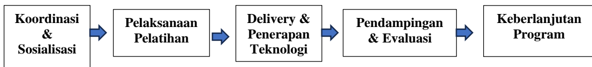
Bagan 1: Lima Tahapan Pelaksanaan PkM

Pelaksanaan kegiatan Pengabdian Masyarakat pada bulan Juli s/d November 2025, sedangkan waktu pelatihannya tanggal 31 Juli s/d 3 Agustus 2025 selama 4 sesi pertemuan (jam 08.00 s/d 13.00) di Aula Kelurahan Kampung Melayu, Kecamatan Jatinegara, Jakarta Timur. Sasaran kegiatan PkM atau mitra sasarnya adalah para Pengurus Bank sampah di 4 RW (RW 02, RW 03, RW 07, dan RW 08) Kelurahan Kampung Melayu yang berjumlah 41 orang. Sedangkan mitra pendukung meliputi: a) Kelurahan Kampung Melayu yang menyediakan tempat pelatihan (Aula Kelurahan), b) Lembaga Konseling FKIP, Fakuktas Kesehatan, dan Fakultas Sains & Teknologi Universitas Islam As-Syafi'iyah (UIA) Jakarta sebagai penyedia narasumber. Metode Pelaksanaan PkM meliputi 5 (lima) tahap berikut.