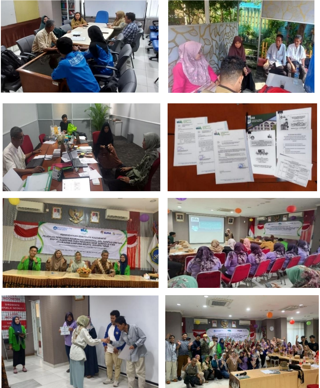
Gambar 2. Kegiatan Koordinasi/Sosialisasi, Persiapan, Pembukaan, Pelaksanaan, Evaluasi & Penutupan Pelatihan

Pemberian bantuan bagi 4 Bank Sampah di RW 02, RW 03, RW 07 dan RW 08 di Kelurahan Kampung Melayu berupa 8 item perlengkapan/peralatan teknologi & inovasi sederhana untuk mengoptimalkan pengelolaan Bank Sampah baik hard maupun soft yang meliputi : a) 12 buah timbangan gantung digital; b) 4 buah tong sampah ‘Dustbin’ 120 L; c) 4 buah troli foldable platform 300 kg; d) 4 buah lemari high cabinet plat baja stainless; e) 12 buah cutter plastik; f) 48 pasang sarung tangan sampah; g) 1 buah pisau pencacah plastik; h) 1 buah mesin pencacah plastik (lihat Gambar 3).