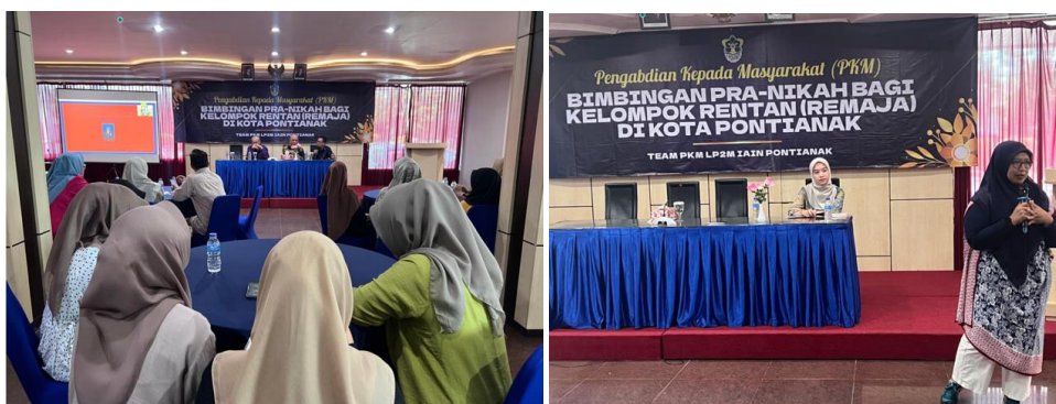
Gambar 1. Pelaksanaan Kegiatan PKM Melalui Kegiatan Bimbingan Pra-Nikah

Tahap ketiga adalah implementasi program, yang dilaksanakan melalui serangkaian sesi pelatihan interaktif selama delapan minggu. Sesi-sesi ini menggabungkan metode ceramah, diskusi kelompok, role-playing, simulasi, dan studi kasus. Tim fasilitator terdiri dari ahli Pendidikan pra-nikah, psikolog, dan ulama yang secara kolaboratif memberikan materi secara aplikatif sekaligus mengembangkan keterampilan praktis peserta dalam menghadapi dinamika kehidupan pernikahan.