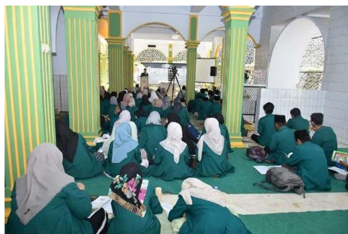
Gambar 2 kegiatan Mahasiswa

Seluruh kegiatan tersebut berjalan dalam suasana kolaboratif. Mahasiswa tidak hanya ditempatkan sebagai peserta, tetapi juga sebagai penggerak kegiatan, misalnya menjadi moderator diskusi, penulis laporan, maupun panitia teknis. Dengan cara ini, mereka mendapatkan pengalaman belajar yang lebih menyeluruh, baik dari sisi intelektual, spiritual, maupun manajerial.