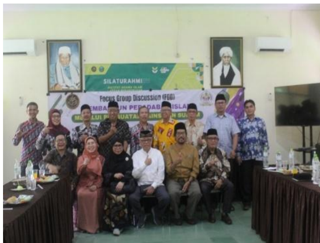
Gambar 3 Bersama Dosen