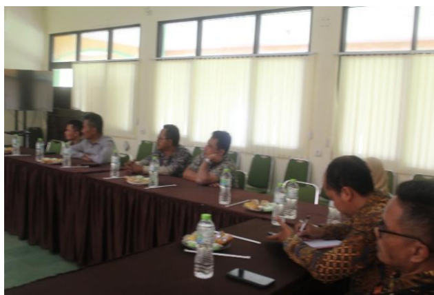
Gambar 4 Kegiatan Workshop Dosen dan Mahasiswa