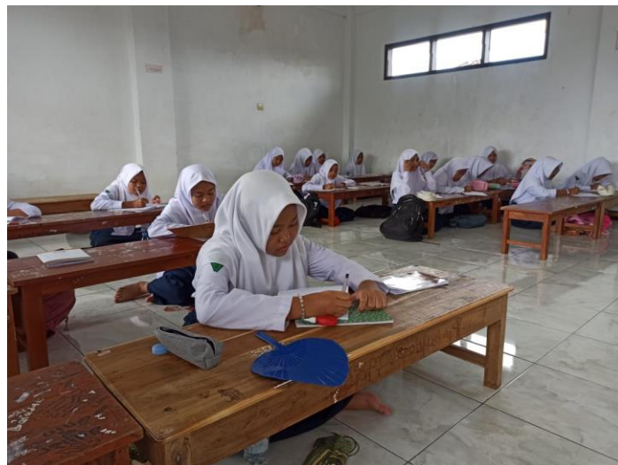
Gambar 3. Kegiatan Pembelajaran Bahasa Arab Menggunakan Aplikasi Baina Yadaik di Kelas VII

Tahap implementasi dilakukan dengan menerapkan langsung aplikasi Baina Yadaik dalam proses pembelajaran bahasa Arab di kelas VII. Guru menggunakan video pembelajaran interaktif yang sudah terintegrasi dalam aplikasi tersebut, menampilkan percakapan sehari-hari sesuai tema dalam modul ajar. Melalui koneksi ke smart TV, seluruh siswa dapat menyimak dan berinteraksi bersama-sama dengan media pembelajaran. Proses belajar berlangsung aktif karena siswa dapat mendengarkan pelafalan yang benar dan memahami konteks percakapan melalui gambar, suara, dan teks secara simultan. Dengan demikian, metode Baina Yadaik membantu menciptakan suasana belajar kolaboratif yang menarik dan komunikatif.