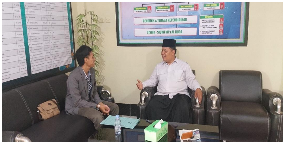
Gambar 1. Wawancara dengan Kepala Sekolah MTs Al Huda Bandung

Tahap analisis kebutuhan dilakukan melalui observasi kelas dan wawancara dengan Kepala Sekolah sekaligus guru bahasa Arab. Berdasarkan hasil pengamatan, diketahui bahwa proses pembelajaran masih bersifat konvensional dengan dominasi metode ceramah dan hafalan mufradāt tanpa dukungan media audio-visual. Guru menyampaikan bahwa siswa sering mengalami kesulitan dalam memahami makna percakapan dan pelafalan yang benar karena terbatasnya media pendukung. Melalui wawancara, diperoleh data bahwa sebagian besar siswa menunjukkan antusiasme rendah terhadap pelajaran bahasa Arab karena proses pembelajarannya monoton dan kurang menarik. Hasil analisis ini memperkuat pentingnya penerapan media pembelajaran digital yang mampu menggabungkan unsur visual, audio, dan interaksi langsung antara guru dan siswa.